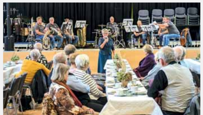
... mit Gästen und den Musikanten von BergBlech