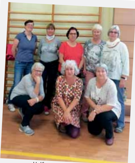
Helferteam am Sonntag