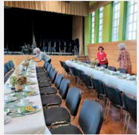
Blick in die dekorierte Halle