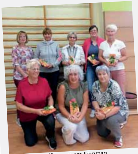
Helferteam am Samstag