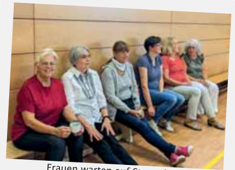
Frauen warten auf Startschuss